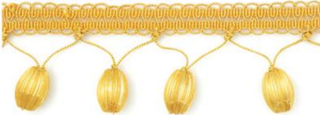
Groline Colombola tissée main 72 mm - Handwoven double gimp Colombola 064 75 530