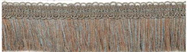
Fringe Ca d'Oro à jasmins 60 mm - Fringe Ca d'Oro with jasmins 064 72 200