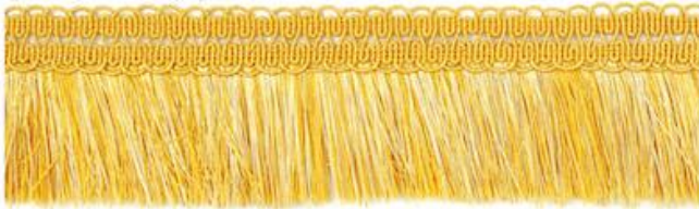
Frange Ca d'Oro à jasmins 60 mm - Fringe Ca d'Oro with jasmins 064 72 200