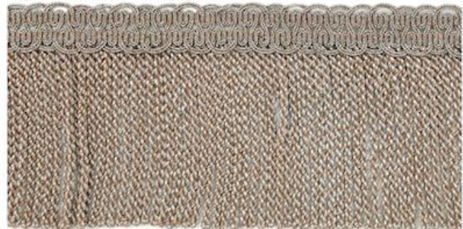
Fringe moulinée Giudecca 90 mm - Bullion fringe Giudecca 064 72 204