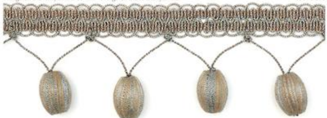
Grosline Colombola tissée main 72 mm - Handwoven double gimp Colombola 064 75 530