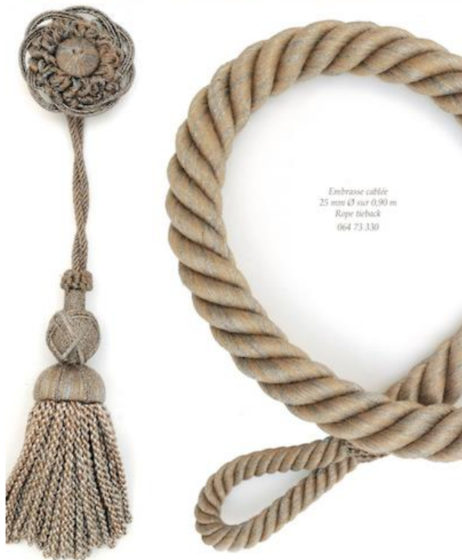
Embrasse cablée 25 mm Ø sur 0,90 m Rope tieback 064 73 330