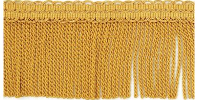
Frange moulinée Gludacca 90 mm - Bullion fringe Gludacca 064 72 204